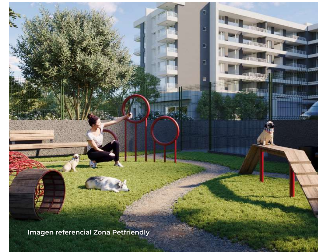
Imagen referencial Zona Petfriendly