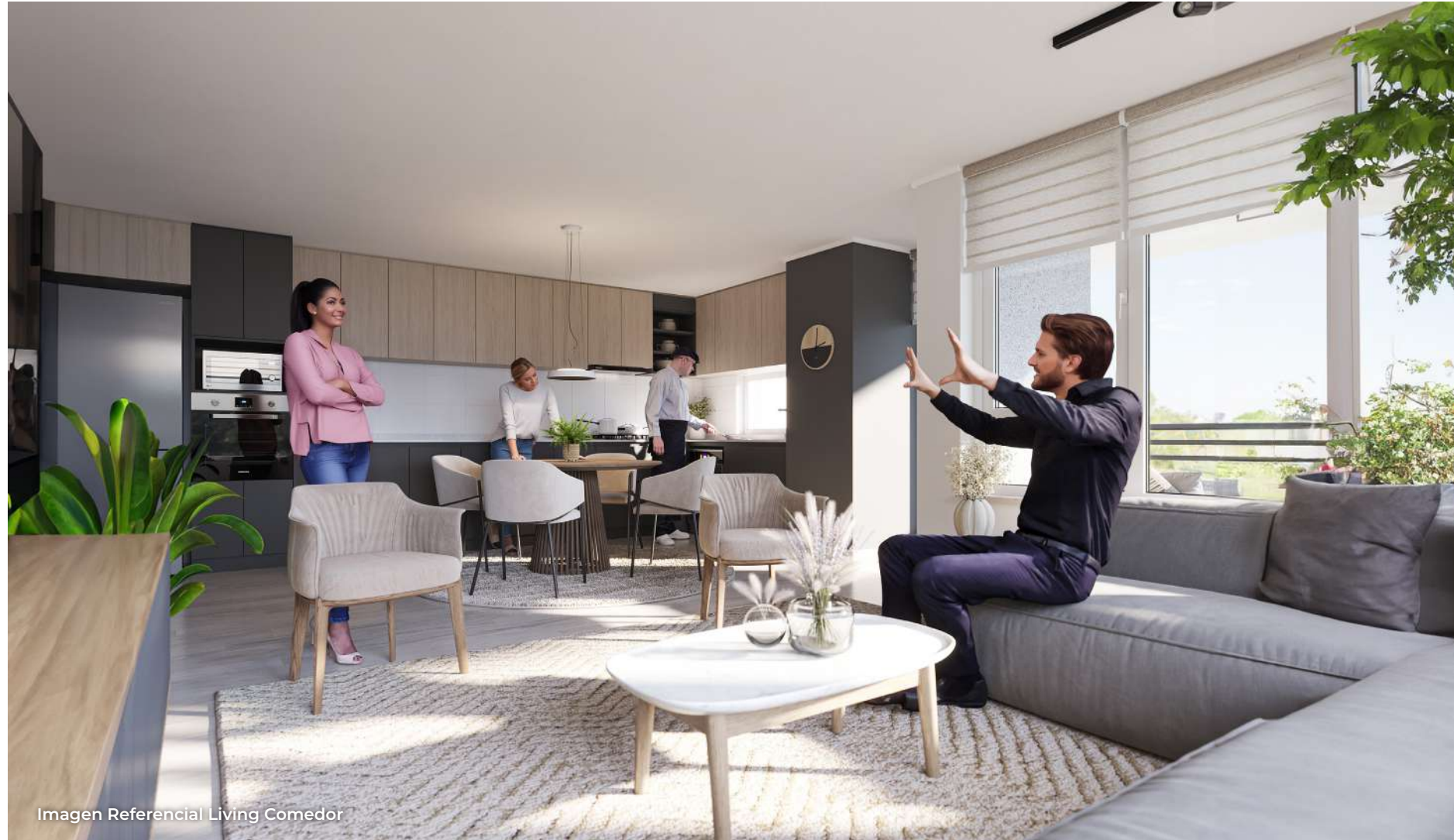
Imagen Referencial Living Comedor