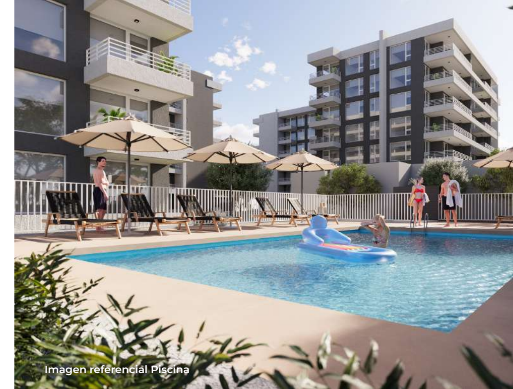
Imagen referencial Piscina