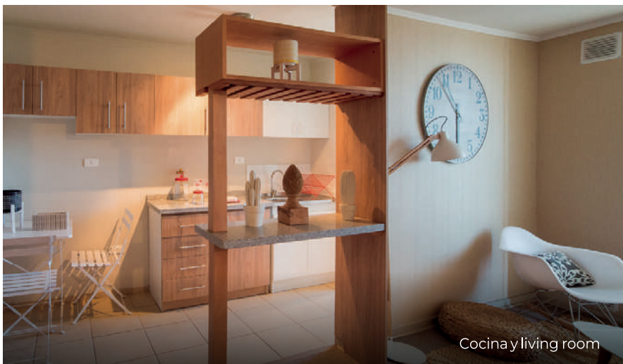
Cocina y living room