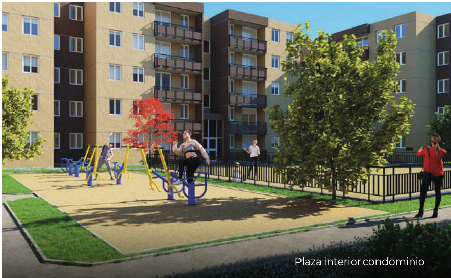
Plaza interior condominio