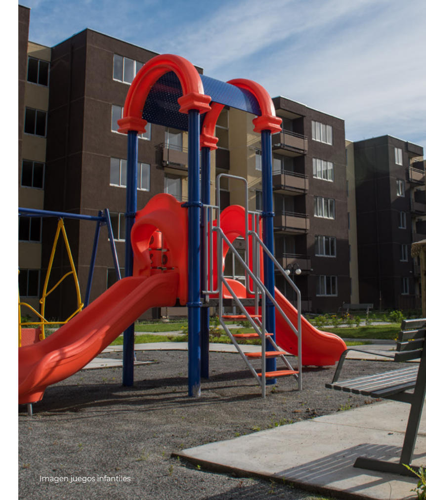
Imagen juegos infantiles