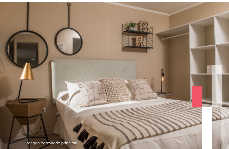
Imagen dormitorio principal