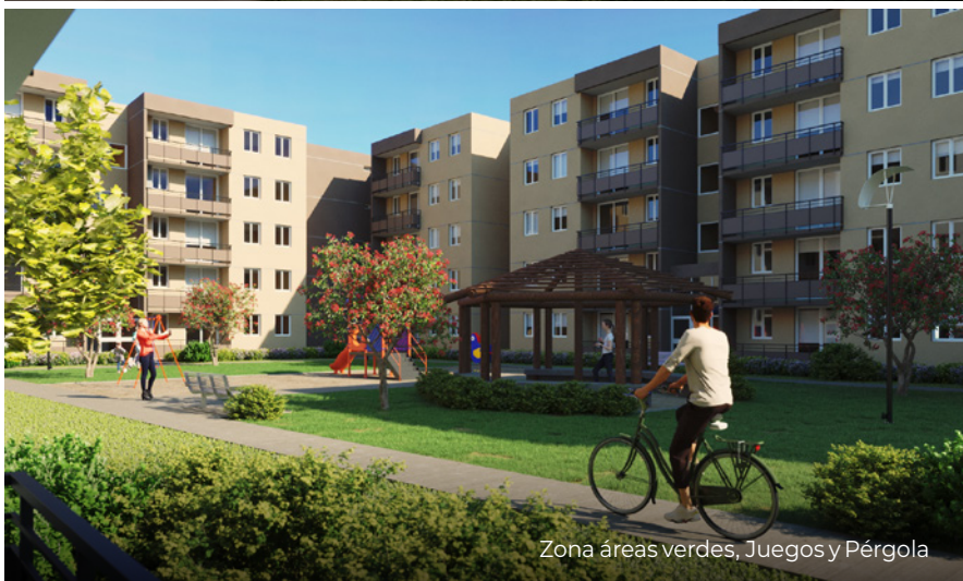
Zona áreas verdes, Juegos y Pérgola