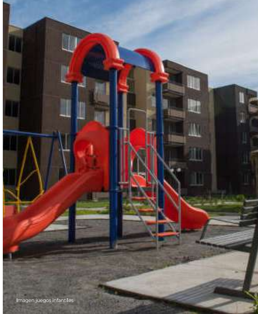
Imagen juegos infantiles