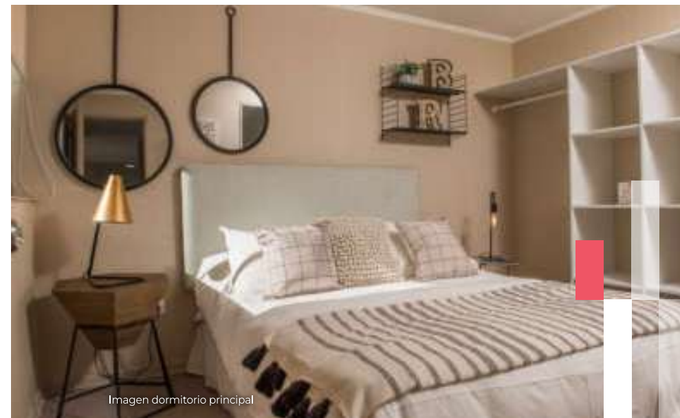
Imagen dormitorio principal